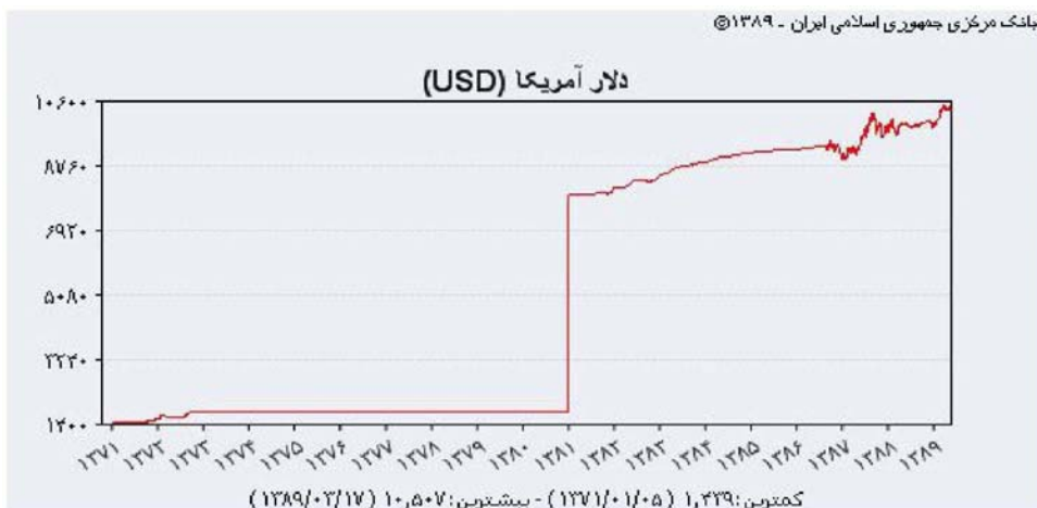
شکل ۱: نمودار نرخ ریال ایران در برابر هر دلار آمریکا

نمی‌باشد، که شکل ۲ نمودار درصد تغییرات لگاریتم نرخ ریال ایران در برابر هر دلار آمریکا گویای این واقعیت می‌باشد. بنابراین در نظر گرفتن دو رژیم منطقی‌تر به نظر می‌رسد. ابتدا مدل اتورگرسیو خطی را به داده‌ها برازش داده، سپس مدل‌های SETAR و MSAR برازش داده می‌شود.